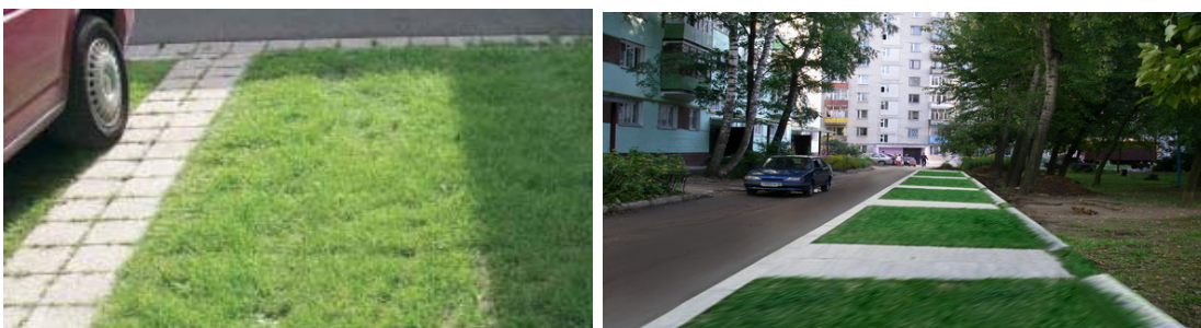
Схема устройства экопарковки

Проблема решается с помощью применения газонной решетки. Технология применения модульной газонной решетки — это возможность сохранить красивый зеленый газон и при этом значительно укрепить грунт на автостоянках для грузового и легкового транспорта, стоянках для катеров и яхт, территориях вокруг спортивных и оздоровительных сооружений, подъездных дорогах к гаражам, проездах для пожарного и сервисного транспорта, при благоустройстве придомовых территорий.